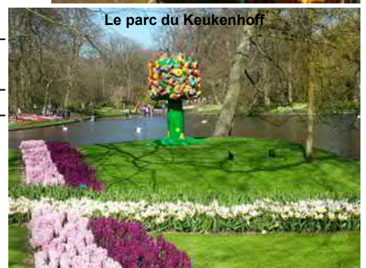
Le parc du Keukenhoff