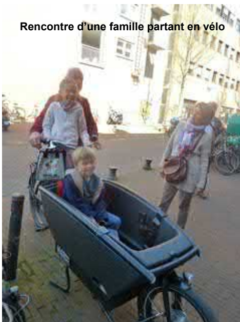
Rencontre d'une famille partant en vélo

Et là malheureusement le temps a manqué surtout que la foule des visiteurs était déjà là. Afin d'éviter la cohue à l'entrée principale, nous sommes passés par une entrée peu connue, mais qui nous a permis de voir rapidement les collections du Siècle d'Or avec entre autres les faïences bleues de Delft. Et nous sommes arrivés dans la galerie d'honneur du musée avec les tableaux des grands maîtres tels que Franz Halz, Jan Steen, Vermeer (La laitière et la lettre), Jan Asselijn (Le cygne menacé défendant la Hollande). Et évidemment la « Ronde de Nuit », le tableau le plus connu et le plus célèbre de Rembrandt van Rijn. Une œuvre imposante et spectaculaire que le musée présente en majesté.